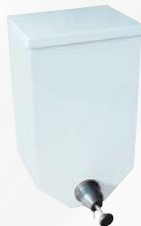
DISPENSER MURALE (non inclusa) Codice 1465